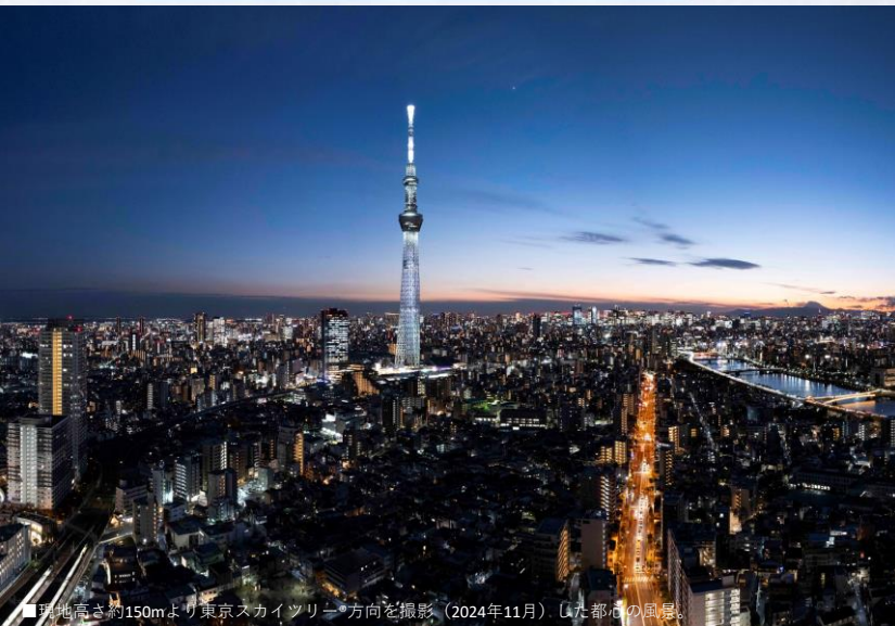
■現地高さ約150mより東京スカイツリー方向を撮影(2024年11月)。(した都心の風景)