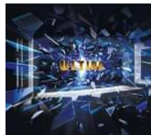
「ULTIRA(ウルティラ)」(イメージ)

立体音響技術「ドルビーアトモス」は、これまでにないリアルなサウンドでシアター内を満ち、制作者の意図通りに縦横無尽に空間内を移動させることで、まるで作品の中に入り込んでしまったかのような没入感を味わうことができます。また、世界中の制作者から絶大な支持を受けており、現在、全世界で4,800以上のスクリーンに導入（予定を含む）され、1,300以上の公開作品に採用されています。