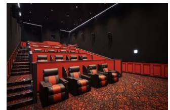
「グランシアター」(イメージ)

北陸のイオンシネマでは初めて、最上級のシートでくつろぎながら映画鑑賞を楽しむ「Gran Theater (グランシアター)」を導入。「電動リクライニングシート」により、足を伸ばし、お客さまの最も居心地の良いスタイルでご鑑賞いただけるよう、特別なVIP感覚のシネマタイムをご用意しました。