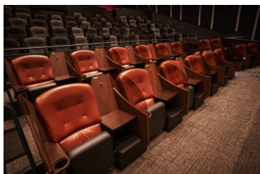
「アップグレードシート」(イメージ)

飛沫対策に上下可動式パーテーションと両サイドのひじ掛けを標準装備した「ノーマルシート」。また、通常より約1.5倍の足元と約2倍の幅広空間で、よりパーソナルスペースを意識した「アップグレードシート」はグランシアターを除く全スクリーンに配置。最大劇場の最前列には、人目を気にせず足を伸ばしてゆったり鑑賞できる「コンフォートシート」を導入します。