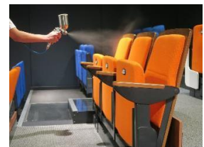
「ヘルスブライトエポリューション」

天然ミネラル 100%の液体で、完全無機剤の安心できる薬剤を座席や劇場扉、壁面などへ塗布することで抗菌・抗ウイルス加工が可能となる「ヘルスブライトエポリューション」を導入しています。