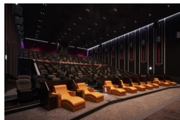
「コンフォートシート」(イメージ)