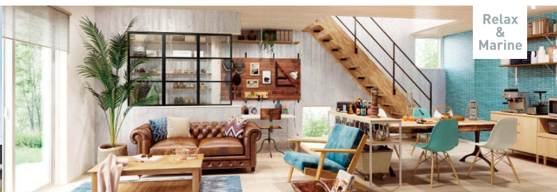
Relax & Marine