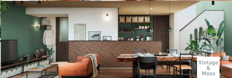
Vintage & Moss