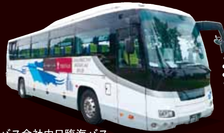
バス会社中日臨海バス