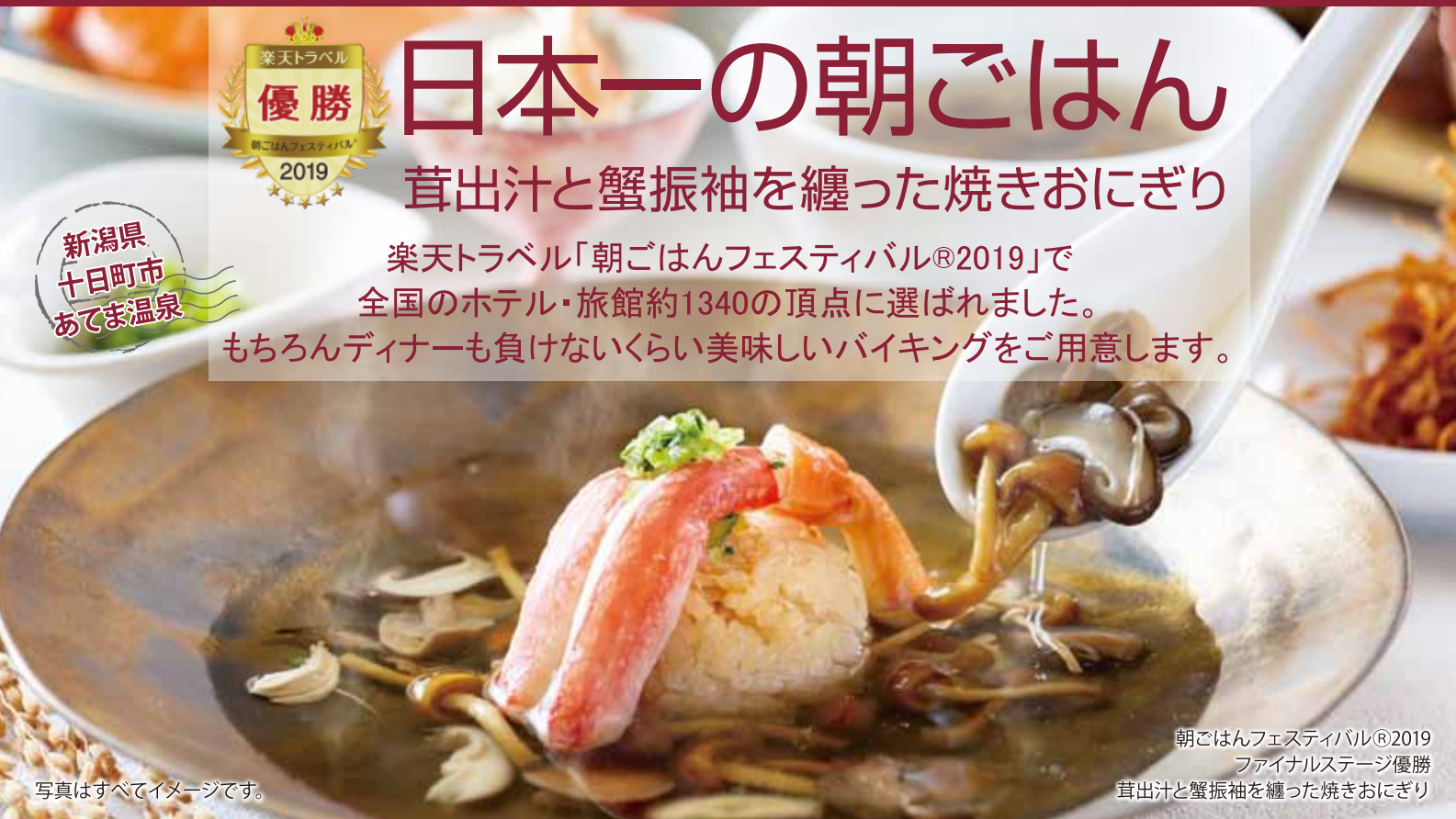
写真はすべてイメージです。