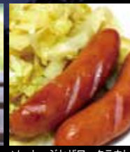
ソーセージとザワークラウト

開催日 11月11日(月)、13日(水)、15日(金) 18日(月)、20日(水)、22日(金)