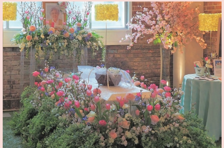
日比谷花壇のサービス項目

早稲田奉仕園スコットホールは「東京都歴史的建造物」に選定された赤レンガ造りの建物です。提携により日比谷花壇はお別れの場としてお借りすることができます。