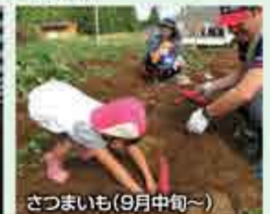
さつまいも(9月中旬～)