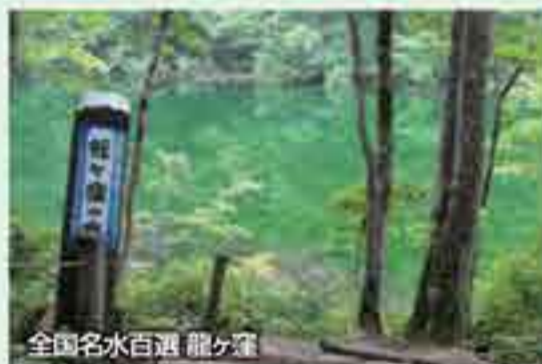
全国名水百選 龍ヶ窪