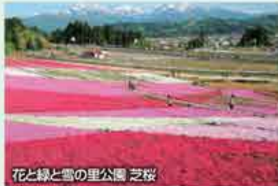
花と緑と雪の里公園 芝桜