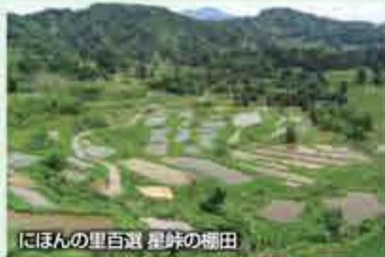
にほんの里百選 星峠の棚田