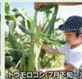
トウモロコシ(7月下旬～)